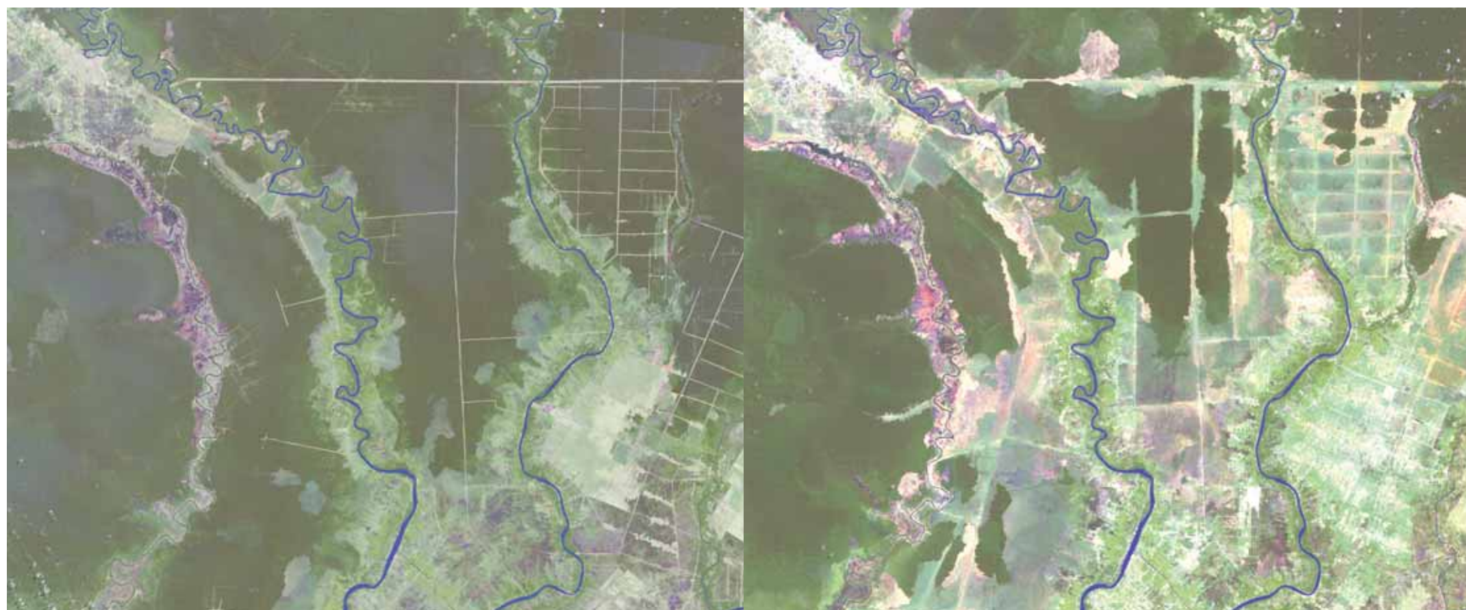
Centraal Kalimantan 1997